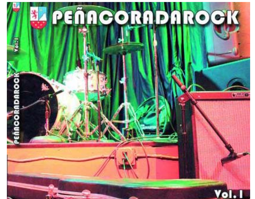
Portada del disco grabado por los alumnos del Conservatorio de Peñacorada.

resados podrán adquirir en el vestíbulo del colegio este disco compacto formado por cuatro temas versionados de míticos grupos de la historia del rock. El disco se abre con 'Letterbomb', del trío estadounidense de punk rock Green Day, para continuar con 'Hysteria', composición de la banda inglesa de rock alternativo Muse. Como tercer tema, los siete componentes del grupo que han realizado la grabación han elegido 'Hey Ho, Let's Go!', de los míticos The Ramones, una de las bandas más influyente de la historia de la música popular, cerrando el compacto el tema 'Tick Tick Boom', de The Hives, una banda de garage rock originaria de Fagersta (Suecia) conocida por sus enérgicos conciertos en directo.