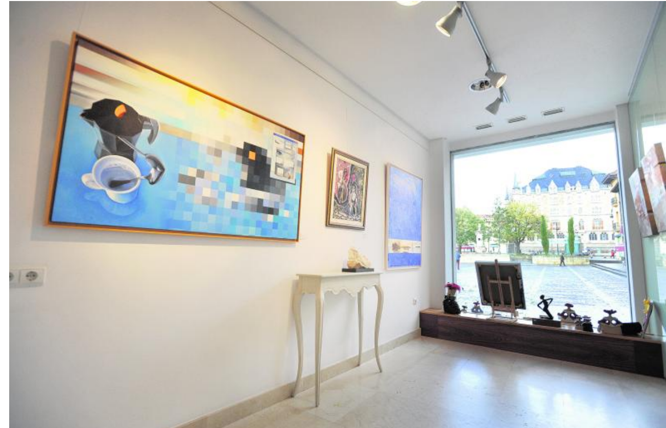
La convivencia de los objetos y de las formas es una de las señas de identidad del artista leonés. :: DANIEL MARTÍN

Nadir reconoce que su pintura es muy ecléctica e igual le inspira el mundo animal que las naturalezas muertas o el paisaje, que a menudo está presente en sus composiciones. «Más que los temas en sí, lo que me interesa es la estructura de los cuadros, la superficie pictórica, que nunca utilizo de un modo tradicional. Así, aparecen una multiplicación de horizontes o una superposición de imágenes jugando con las texturas, o no solo texturas sino también veladuras». Para